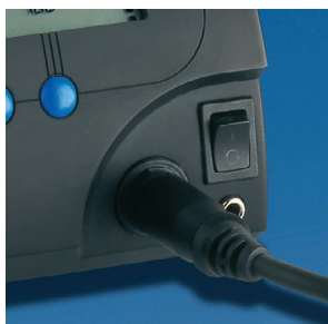
Presa equalizzazione potenziale