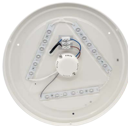
Fig1 Interno plafoniera con particolare del driver alimentazione e morsetto di connessione. Foto indicativa