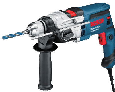
GSB 19-2 RE Professional Cod.ord. 0 601 17B 500